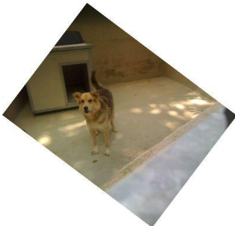
RAOUL , maschio giovane e molto dolce, leggermente timido

Per eventuali ulteriori informazioni fare riferimento ai canili sopra indicati o al Servizio Ambiente comunale , Via Salvi, 4 tel. 0185 4781, fax 0185 478462, Ufficio.Ambiente@comune.sestri-levante.ge.it