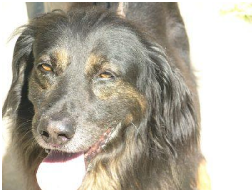
BERNIE , maschio, 3 anni, taglia medio/grande, buonissimo e gestibilissimo, molto bello