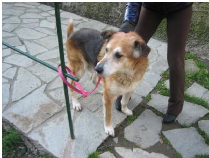
TOMMY , incrocio pastore tedesco, maschio anziano