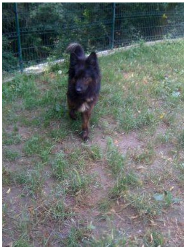
BLADE , maschio adulto caratteriale